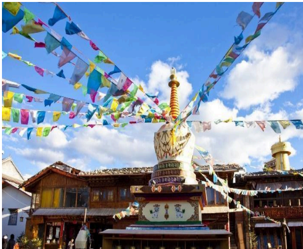
Thành cổ DuKe Zong

ĐẠI LÝ – SHANGRILA (180 KM – 2.5H) (ĂN SÁNG/ TRƯA/ TỐI)