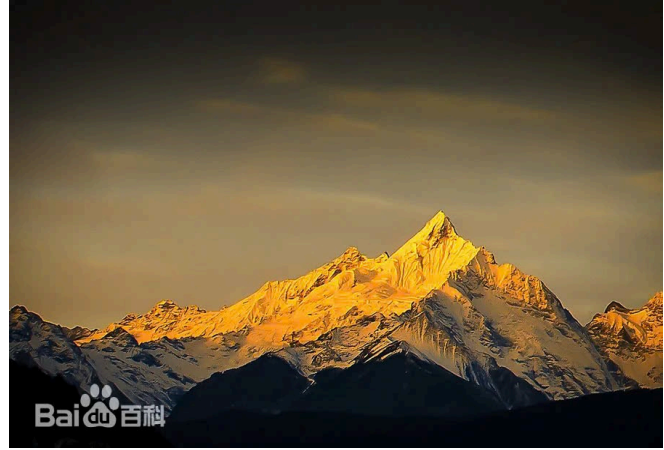
Núi tuyết Mai Lý

Ăn sáng tại khách sạn, Đoàn khởi hành đi đón bình minh tại núi tuyết Mai Lý . Tại Dãy núi tuyết Mai Lý, ánh bình minh vàng óng trên những đỉnh núi phủ đầy tuyết trắng ấn tượng là địa điểm không thể bỏ qua đối với hầu hết khách du lịch. Ánh nắng vàng đầu tiên chiếu trên Kawagebo, đỉnh cao nhất, rồi nhanh chóng lan tỏa khắp 13 đỉnh chính.