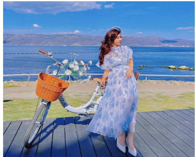
Hồ Nhĩ Hải

Ăn sáng tại khách sạn, đoàn tham quan Hồ Nhĩ Hải - Tại đây, quý khách có thể đi xe đạp dọc theo tuyến đường đạo sinh thái ở cạnh Hồ Nhĩ Hải, check-in tại cung đường chữ S – nơi đóng bộ phim nổi tiếng "Đi đến nơi có gió". (Chi phí thuê xe đạp tự túc).