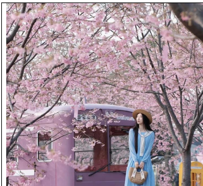
Hoa anh đào tại Mạn Hoa Trang Viên Thành Đô.