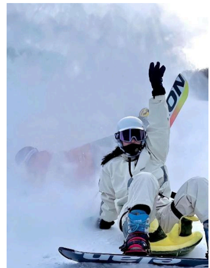
Khu trượt tuyết Gia Cô Sơn