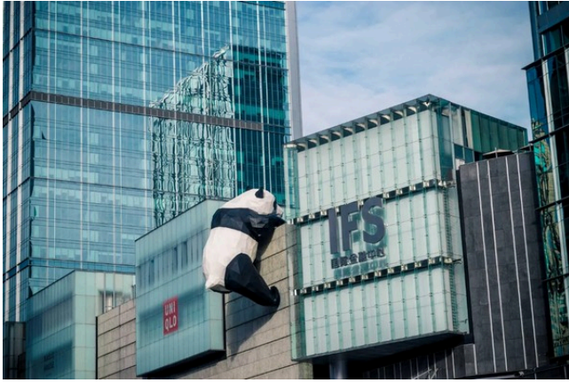
Check-in Gấu trúc treo tường tại phố đi bộ Xuân Hy Thành Đô