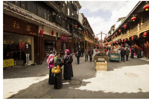
Tùng phan cổ trấn

Sáng: Đoàn trả phòng, ăn sáng và tiếp tục đi tham quan: