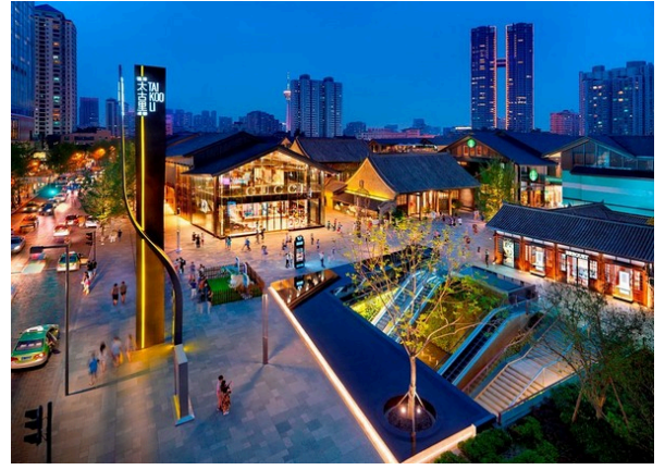
Thái Cổ Lý

05h00 Sáng Xe và HDV đón đoàn tại điểm hẹn cổng chính công viên Thống Nhất đường Trần Nhân Tông đưa đoàn lên sân bay Nội Bài đáp chuyến bay đi Thành Đô. Quý khách tự lên sân bay vui lòng có mặt lúc 06h00 tại sảnh quốc tế - T2 Nội Bài. Liên hệ hướng dẫn viên nhập đoàn.