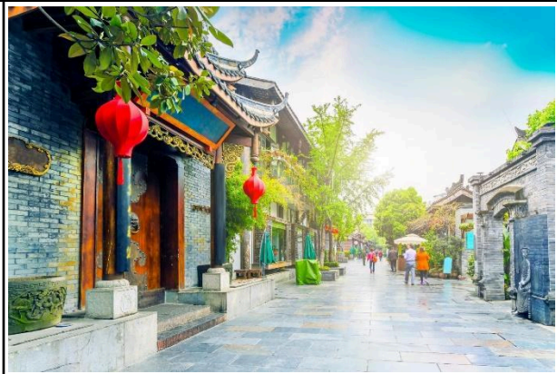
Ngõ Rộng Ngõ Hẹp

Sáng: Đoàn trả phòng, ăn sáng và khởi hành đi tham quan Phố cổ Cẩm Lý dài khoảng 550m, là một phần của đền Vũ Hầu với kiến trúc được xây dựng theo triều đại nhà Thanh, nơi này được coi là thánh địa trong những trang tiểu thuyết Tam Quốc Diễn Nghĩa, dạo quanh khu phố cổ, bạn có thể tận hưởng không gian văn hóa, ẩm thực với những món ăn địa phương cay xé lưỡi vùng Tứ Xuyên. Theo ghi chép lại rằng, từ thời nhà Tần, phố Cẩm Lý đã nổi tiếng bởi việc buôn bán màn treo với màu sắc đa dạng và kiểu dáng phong phú, sang đến thời nhà Thục, con phố này trở thành nơi giao thương sôi động và sầm uất nhất trong vương quốc.