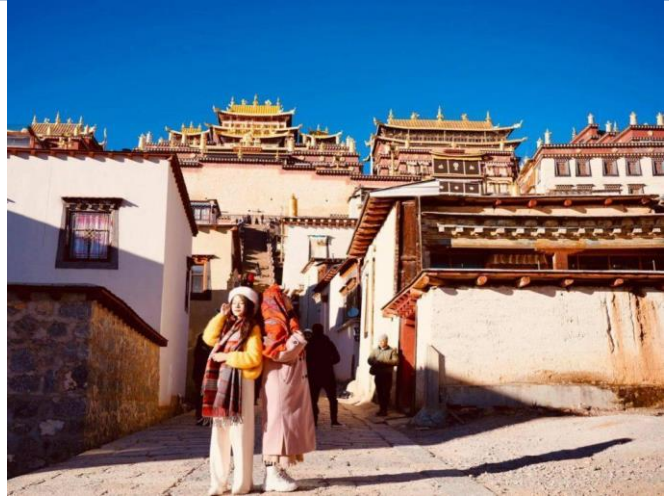
Tu viện Songzanlin

Ăn sáng tại khách sạn, sau đó đoàn khởi hành đi Shangrila – “Vùng đất bất tử” trong tiểu thuyết