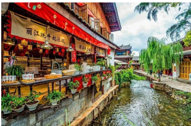
Trấn cổ Lệ Giang

Ăn sáng tại khách sạn, Xe và HDV đưa đoàn khởi thăm quan khu du lịch cấp 4A của Trung Hoa là Thành cổ Đại Lý – phía nam thành cổ đại lý là nước xanh biếc của hồ Nhĩ Hải, phía Tây là quanh năm cây cối tươi xanh của dãy núi Thương Sơn, nơi đây chính là nơi du khách thường hay nhắc đến với cảnh Phong hoa tuyết nguyệt , trải nghiệm cảm giác cổ quốc Nam triệu nhã tình, bạn hoàn toàn có thể buông mình và tận hưởng sự ấm áp của ánh nắng chiếu thành cổ trong làn gió nhẹ nhẹ. Thỉnh thoảng nở nụ cười trên môi với những du khách lạ có duyên ngộ đi ngược chạm vai với mình.