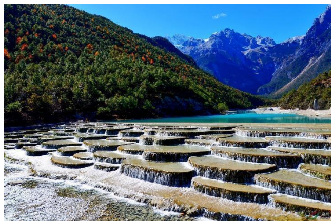
Thung lũng Lam Nguyệt

Ăn sáng tại khách sạn, sau đó đoàn khởi hành đi tới khu vực lịch Núi Tuyết Ngọc Long . Đoàn tham quan: