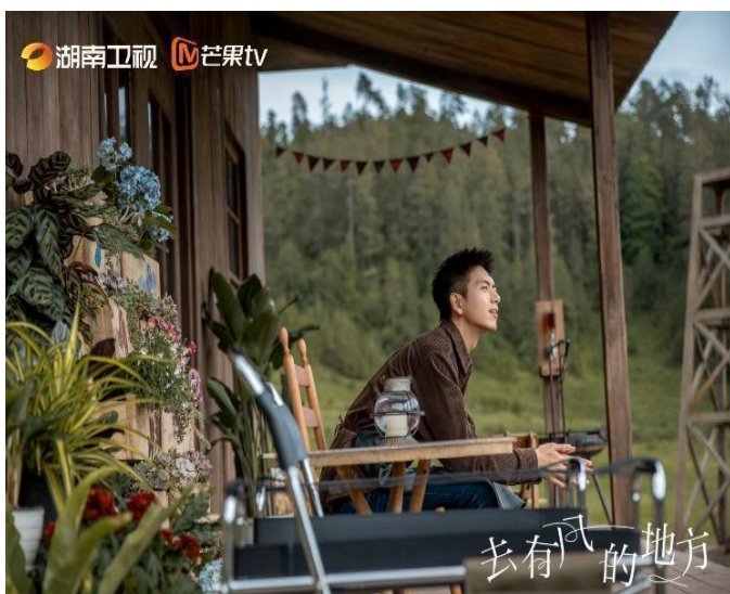
Phương Dương Ấp thôn