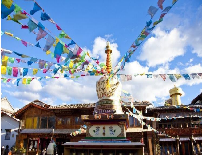
Thành cổ DuKe Zong