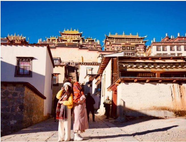
Tu viện Songzanlin

SHANGRILA – LỆ GIANG (ĂN SÁNG/ TRƯA/ TỐI)