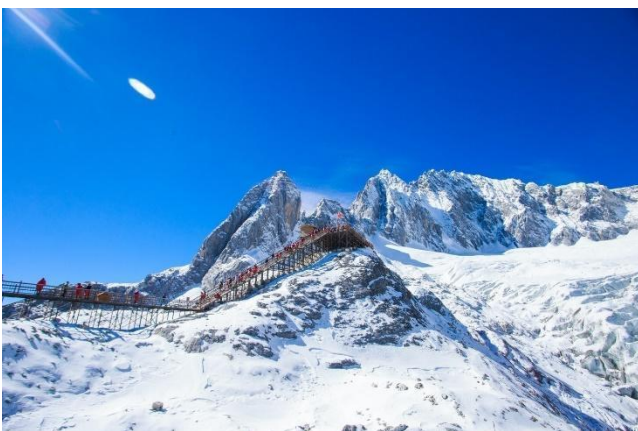
Núi Tuyết Ngọc Long