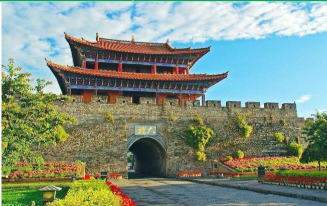
Thành cổ Đại Lý

ĐẠI LÝ - LỆ GIANG (180KM - 2H) (ĂN SÁNG/ TRƯA/ TỐI)