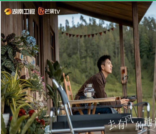
Phương Dương Ấp thôn