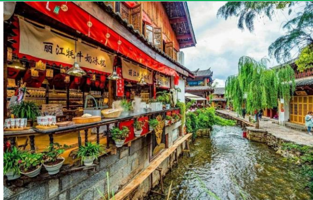
Trấn cổ Lệ Giang

Ăn sáng tại khách sạn, Xe và HDV đưa đoàn khởi thăm quan khu du lịch cấp 4A của Trung Hoa là Thành cổ Đại Lý - phía nam thành cổ đại lý là nước xanh biếc của hồ Nhĩ Hải, phía Tây là quanh năm cây cối tươi xanh của dãy núi Thương Sơn, nơi đây chính là nơi du khách thường hay nhắc đến với cảnh Phong hoa tuyết nguyệt, trải nghiệm cảm giác cổ quốc Nam triệu nhã tình, bạn hoàn toàn có thể buông mình và tận hưởng sự ấm áp của ánh nắng chiếu thành cổ trong làn gió nhẹ nhẹ. Thỉnh thoảng nở nụ cười trên môi với những du khách lạ có duyên ngộ đi ngược chạm vai với mình.