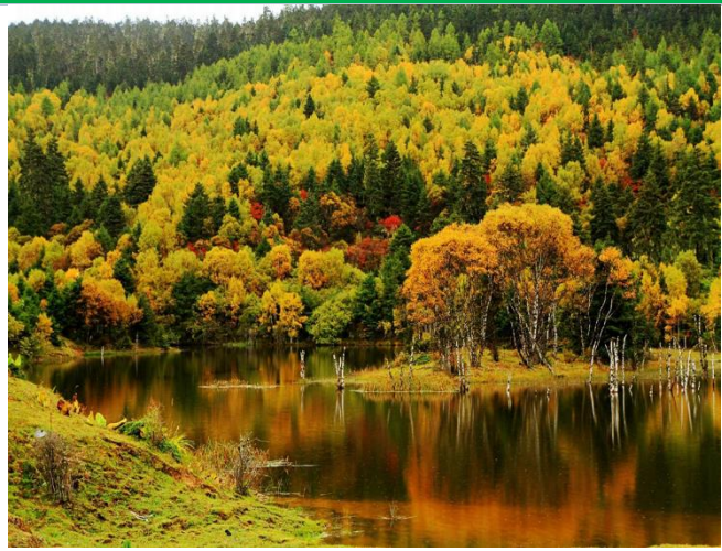
Vườn công viên Quốc gia PuDaCuo