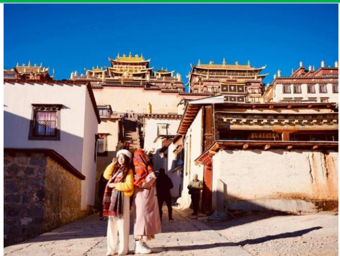
Tu viện Songzanlin

Ăn sáng tại khách sạn, sau đó đoàn khởi hành đi Shangrila – “Vùng đất bất tử” trong tiểu thuyết