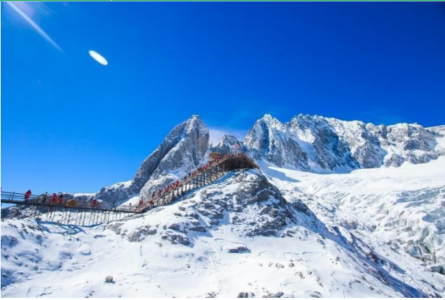
Núi Tuyết Ngọc Long