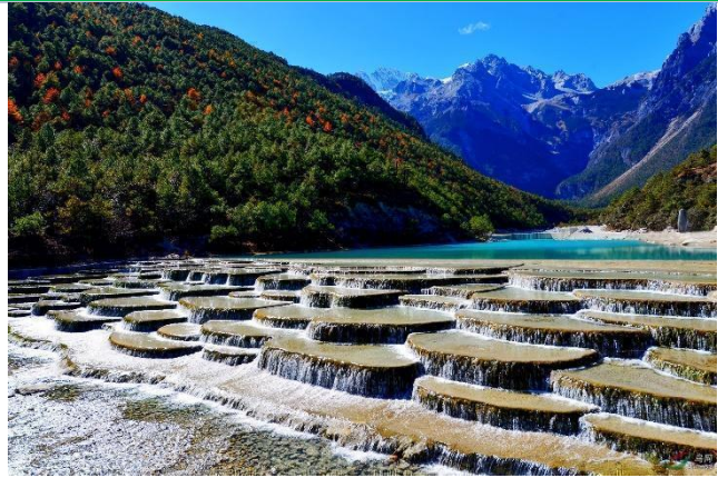
Thung lũng Lam Nguyệt

Ăn sáng tại khách sạn, sau đó đoàn khởi hành đi tới khu lịch Núi Tuyết Ngọc Long . Đoàn tham quan: