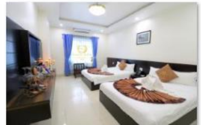
Family room 2