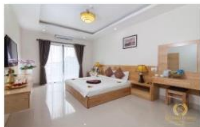
Double room 3