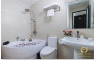
Rest room 1