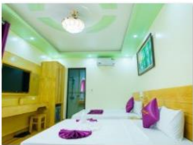
Triple room 2