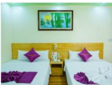
Twin room 2