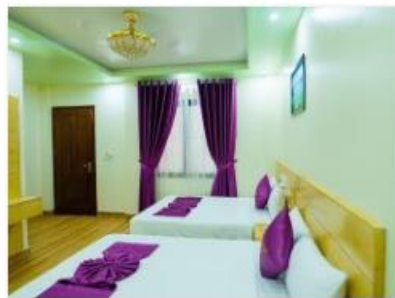
Triple room 3