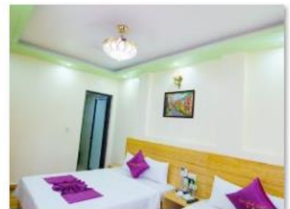
Twin room 1