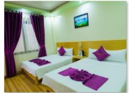
Triple room 1