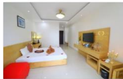
Double room 5