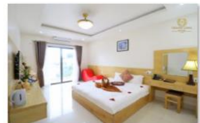
Double room 1