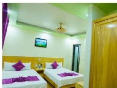
Twin room 3