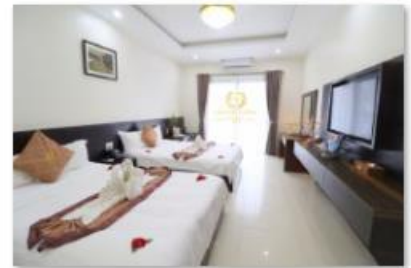
Triple room 3