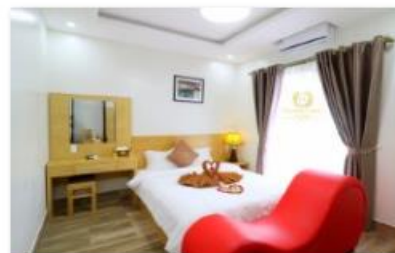
Double room 2