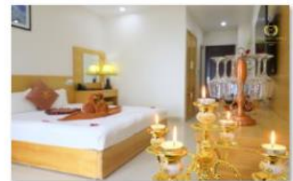
Double room 4