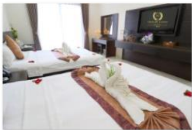
Triple room 2