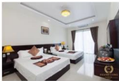
Triple room 1