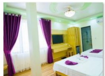
Twin room 4